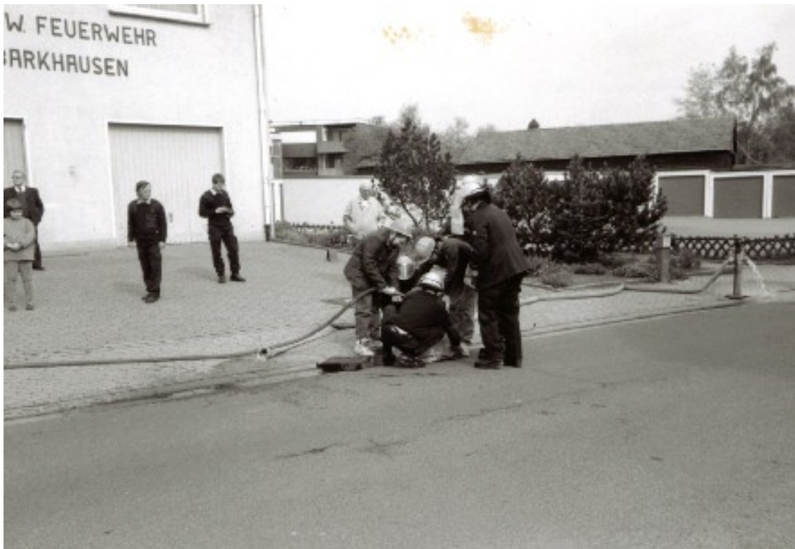
Gemeinsame Schauübung der Jugend mit den Aktiven, mit Gullydichtkissen